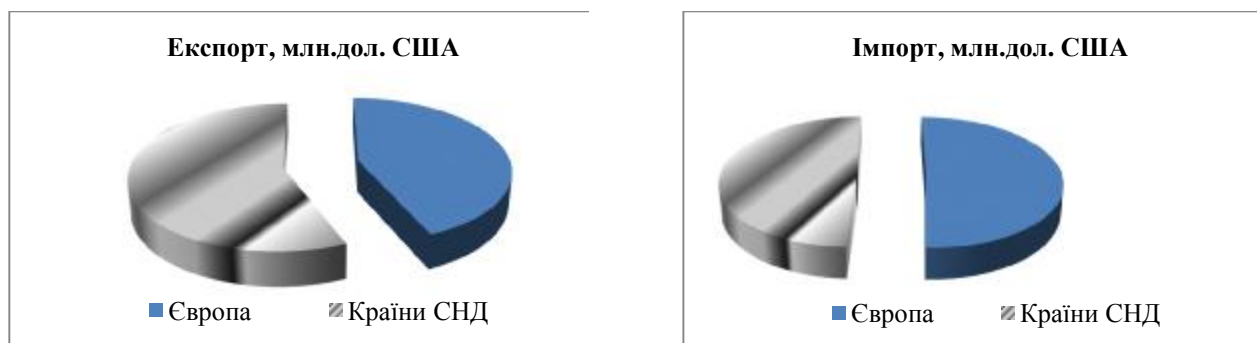
Рис. 1. Зовнішня торгівля України з ЄС та РФ за 2013 рік

Проаналізуємо статистичні данні щодо зовнішньої торгівлі України з ЄС та РФ за 2013 рік.