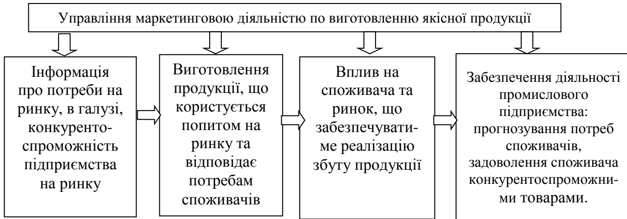
Рис. 1. Управління маркетинговою діяльністю по виготовленню якісної продукції на промислових підприємствах. [3, с. 609; 4, с. 220]

Так, досліджуючи праці науковців, а також враховуючи сучасний підхід до якості продукції, потреб споживача та ринку авторами розроблено систему управління маркетинговою діяльністю підприємства. На рис. 1 виділено першочергові завдання маркетингового управління діяльністю промислового підприємства та подано процес формування впливу на споживача, попит, ринок та розвиток галузі та підприємства.